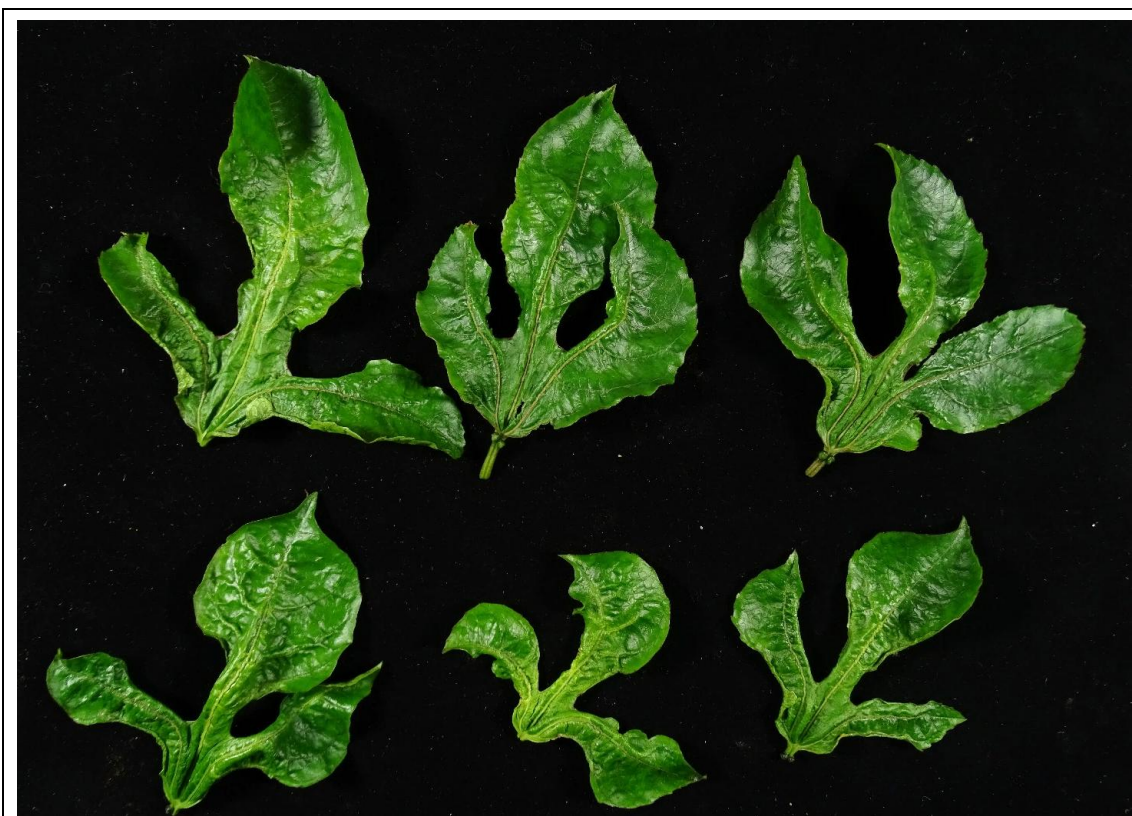
細蟎造成葉片畸形扭曲、葉肉增厚。