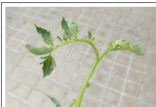
被害葉皺縮，葉色變淡或呈淺褐色