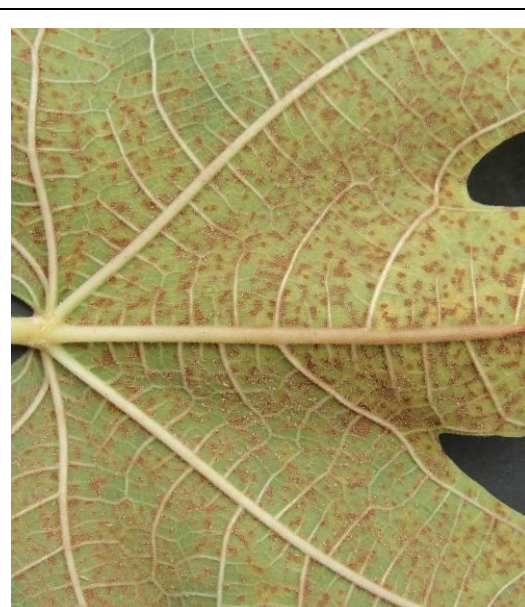
葉片背面褐色突起