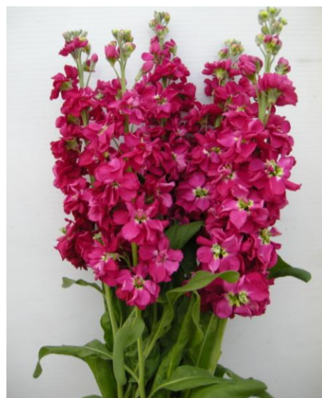
紫羅蘭臺南 2 號花朵性狀