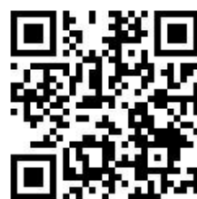
植物保護資訊系統