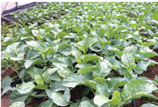
↑「芥藍臺南1號」田間生長情形