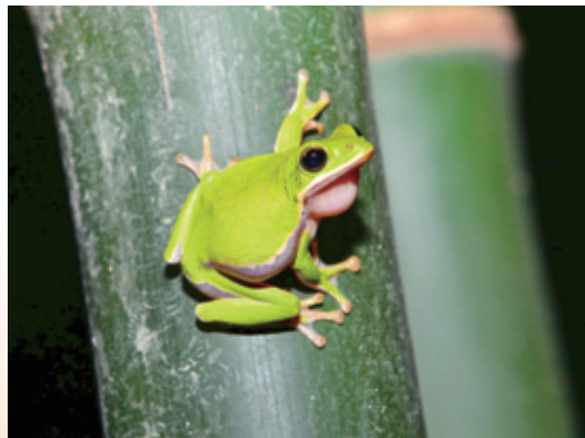
↑綠保竹筍田提供諸羅樹蛙繁殖好場所