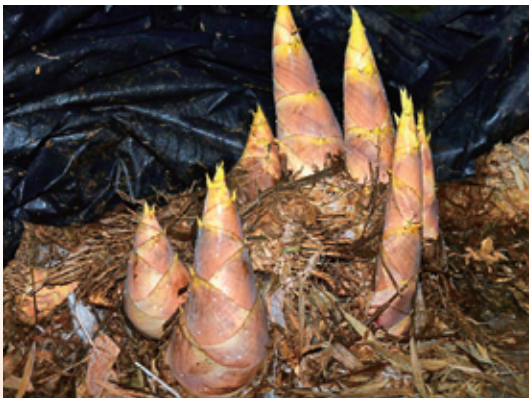
↑土壤改善後特級筍增加