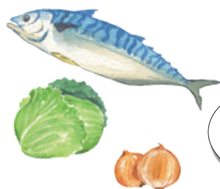
長盈海味屋 榮獲本屆金獎