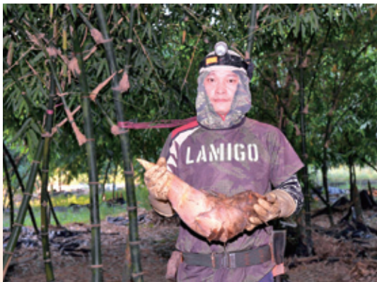
↑土壤改善後促進竹筍生長