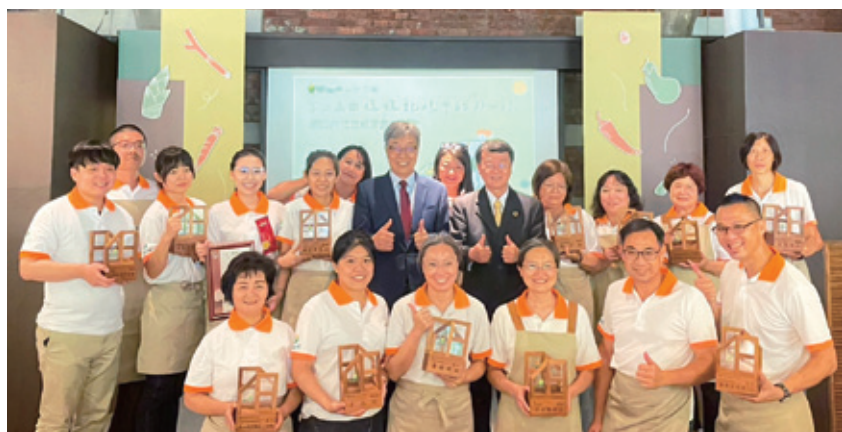
↑第二屆田媽媽「十二味」大合照