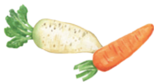
鵝鄉園餐廳 榮獲本屆優勝